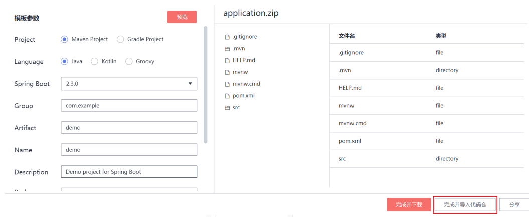
图 1-1 完成并导入代码仓

新建模板产物填写好模板参数并单击“预览”后，“完成并导入代码仓”中的“代码仓”指的是什么？什么情况下要使用这个功能？